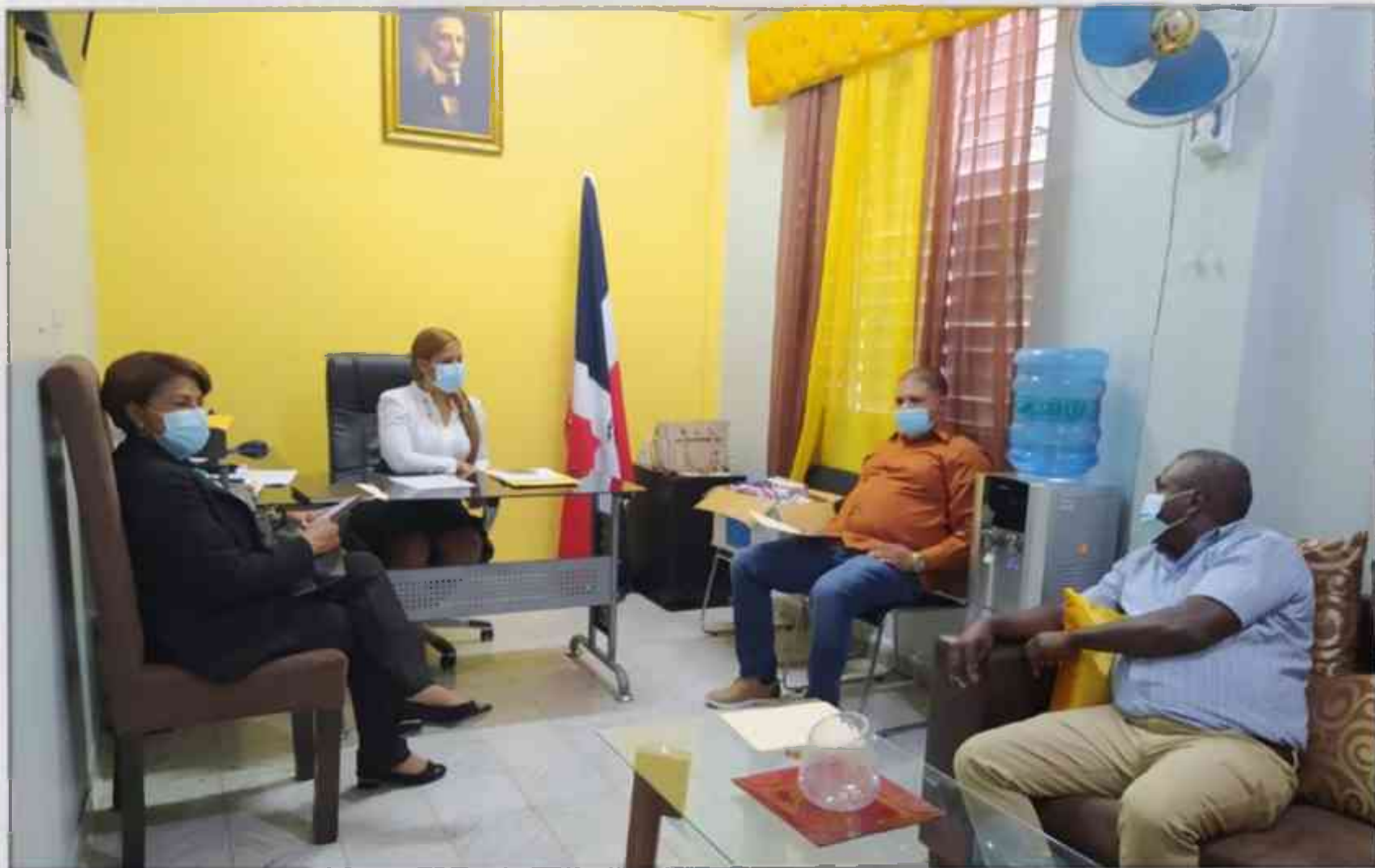
Regional 18 Neiba